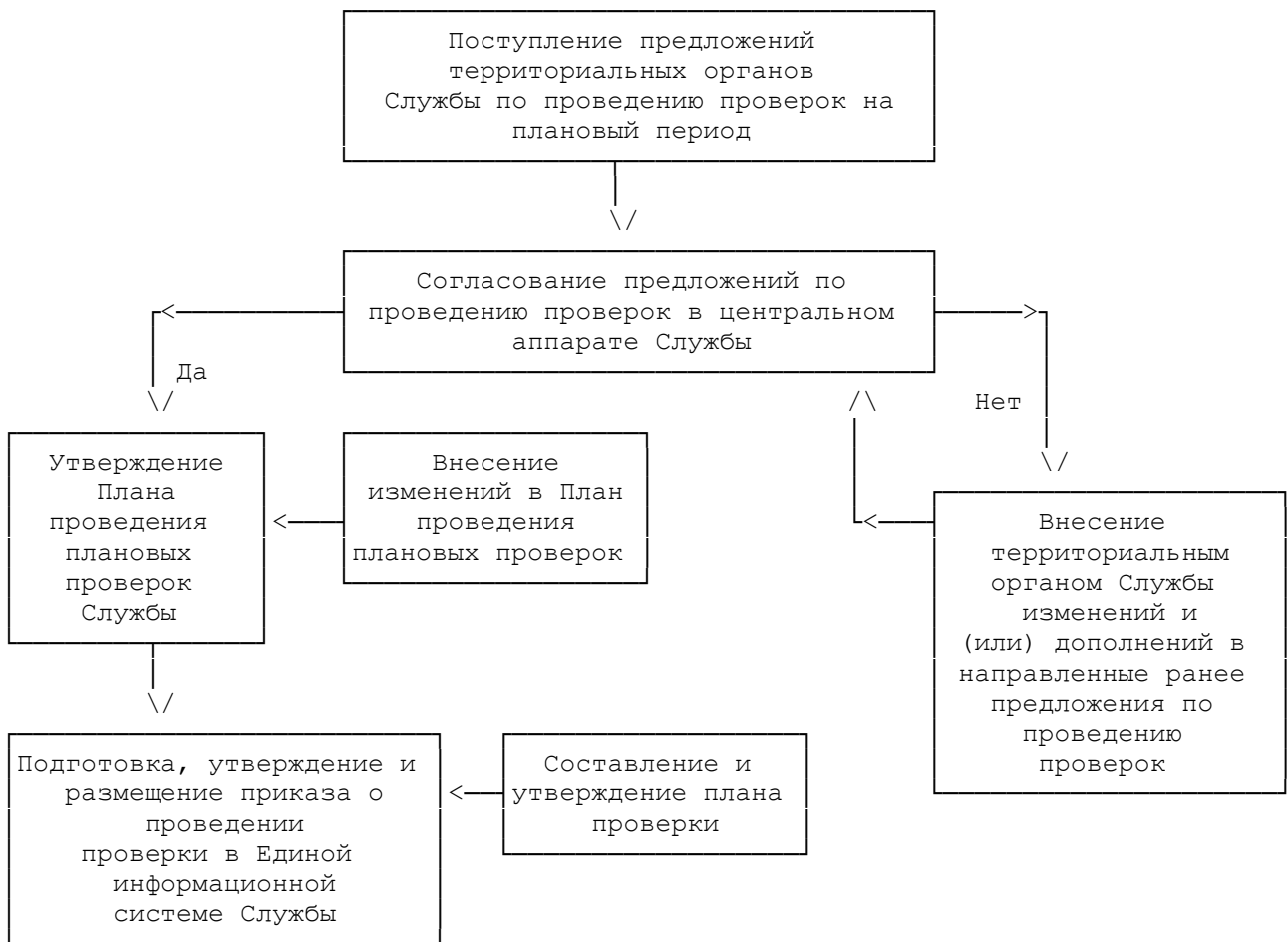
Блок-схема административной процедуры проведения проверок